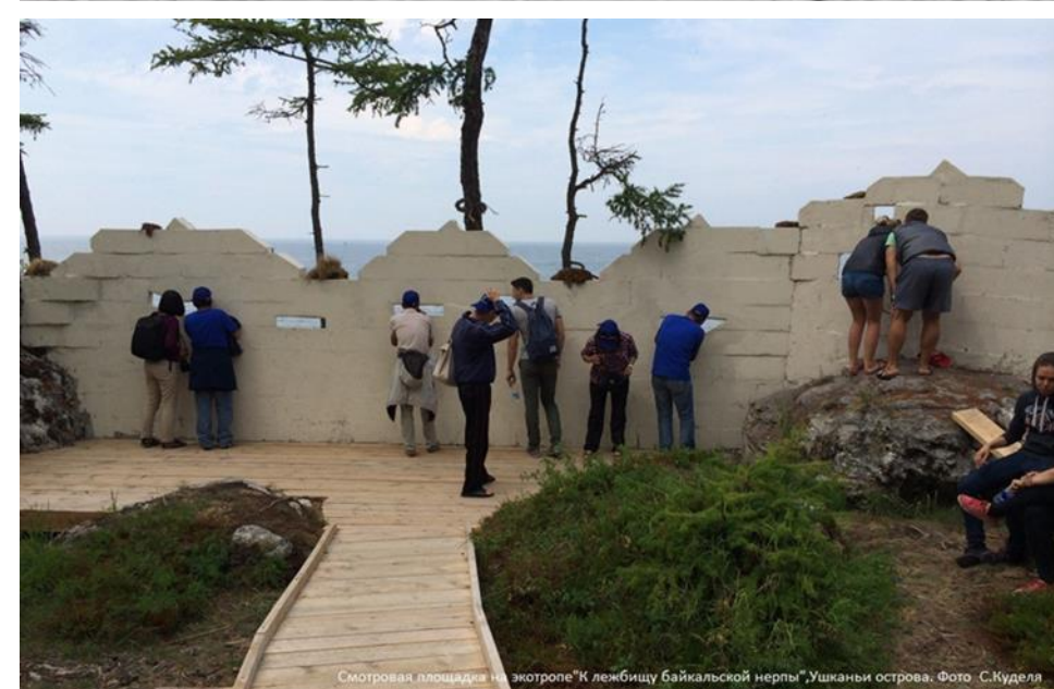
Смотровая площадка на экотропе "К лежбищу байкальской нерпы", Ушканьи острова.